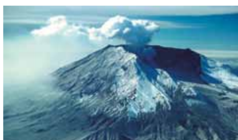
vulcanul HEKLA – Islanda, sursa materiei prime