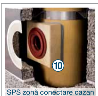
SPS zonă conectare cazan

1020 – marcaj al certificării date de către Institutul de Construcții, Tehnologie și Cercetare din Praga